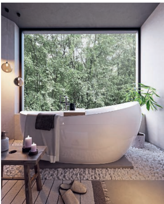
Die neu gestalteten Suiten stehen für eine luxuriöse Wohlfühlhauszeit. Hier eines der Bäder mit Blick in die Natur.

Martin Pircher, Hotel Avidéa Adults Only